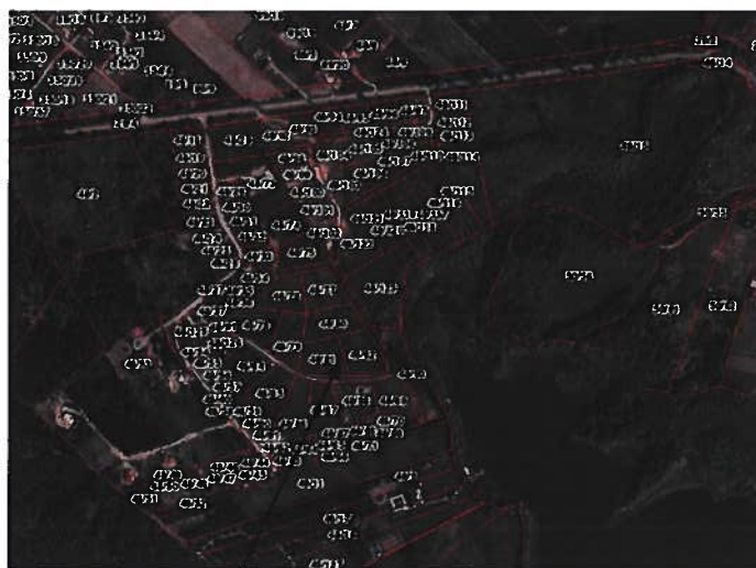
Ryc. 1. Lokalizacja terenów objętych analizą.

Teren projektowany do objęcia zmianą planu zlokalizowany jest w centralnej części Gminy Ełk, w obrębie geodezyjnym Mrozy Wielkie i stanowi działki oznaczone nr 48/81 i 48/82, będące własnością osób fizycznych. Działki te posiadają dostęp do drogi gminnej – ul. Zielonej poprzez drogi wewnętrzne oraz dostęp do sieci infrastruktury technicznej: elektronenergetycznej; sąsiadują z terenami zrealizowanej zabudowy mieszkaniowej jednorodzinnej.